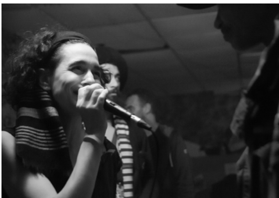
Tous Unis Pour L'Éthiopie - 18.5.19

En partenariat régulier avec d'autres acteurs de la musique et de la culture de la ville ( Centre Culturel de Vitry-sur-Seine, le département jazz du conservatoire de Vitry et d'Ivry), la scène musicale des Barges de l'Écluse a su trouver sa place dans le paysage culturel de la ville.