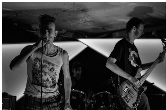
Fête du Pont du Port à l'Anglais - 13.4.19 - Le Pavé