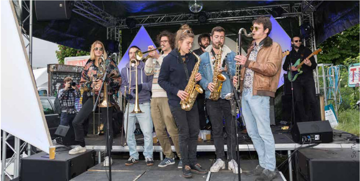
Disco Bagarre - 4.5.19 - La Pègre Douce