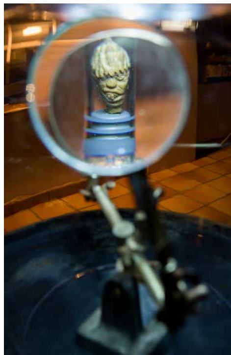
Les noyaux d'olive sculptés de Nickop

Actuellement, la Galerie des Barges propose une exposition par mois ouverte au public du mercredi au dimanche de 13h à 19h durant deux semaines.