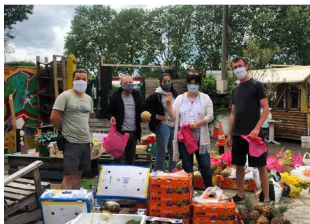
Collecte de dons

L'Asso Sobarjo est une association qui, malgré la crise actuelle et les nouvelles réglementations liées à celle-ci, ne cesse de s'adapter et continue d'offrir aux Vitriote-e-s des activités dans le respect des règles sanitaires.