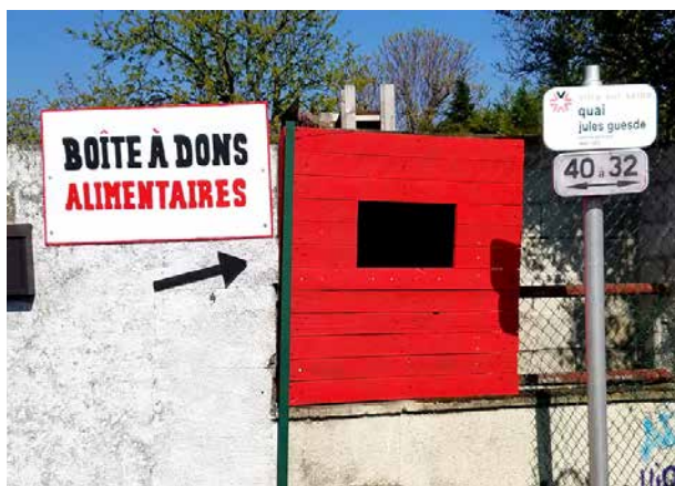
Boîte à dons alimentaires à l'entrée

Ce collectif, hébergé dans l'enceinte des Barges de l'Écluse et constitué notamment des associations La Sauce, CAPSAA, Solidarité Internationale, Les Uns et les Autres, au Delà des Murs, La Fabrique, Réchauffons Corps et Ames, Bio-Divers-Cité et Sobarjo, a réussi à offrir aux plus démunis, au plus fort de la crise, un total de 400 paniers repas et 200 repas chauds par semaine, grâce à la récupération alimentaire, la gestion de ces denrées et la mise en place d'un système de distribution.