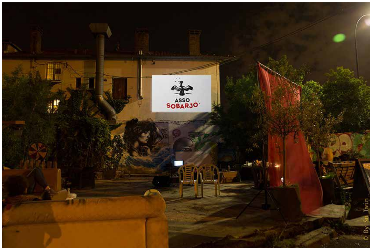
Les Barges en Fête - 28.7.19

De multiples œuvres de graffiti et de street-art ornent les murs des Barges de l'Écluse, mais surplombant toutes ces œuvres, sur le bâtiment côté cour, un grand rectangle blanc attire l'attention... C'est le CinéBarjo ! Cinéma de plein air mis en place par les membres de l'Asso Sobarjo, il a déjà accueilli de multiples projections cinématographiques, lors de divers événements.