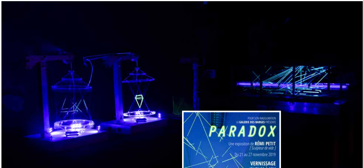
Exposition de Rémi Petit - 21.11.19